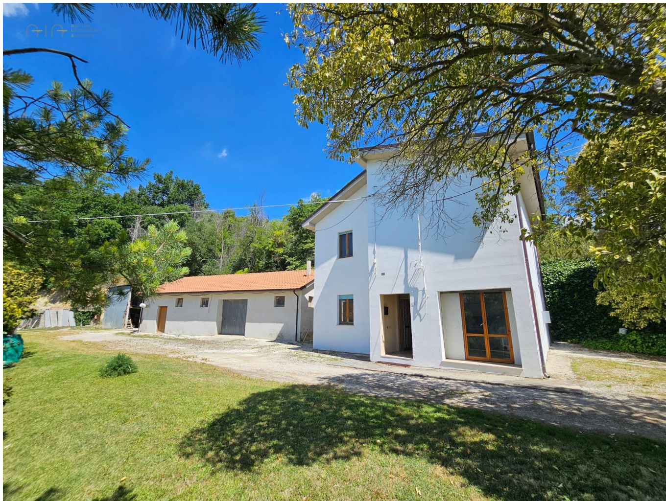
Casa delle Ciliegie

350 mq | Bagni: 1 | Camere: 3 | Locali: 5