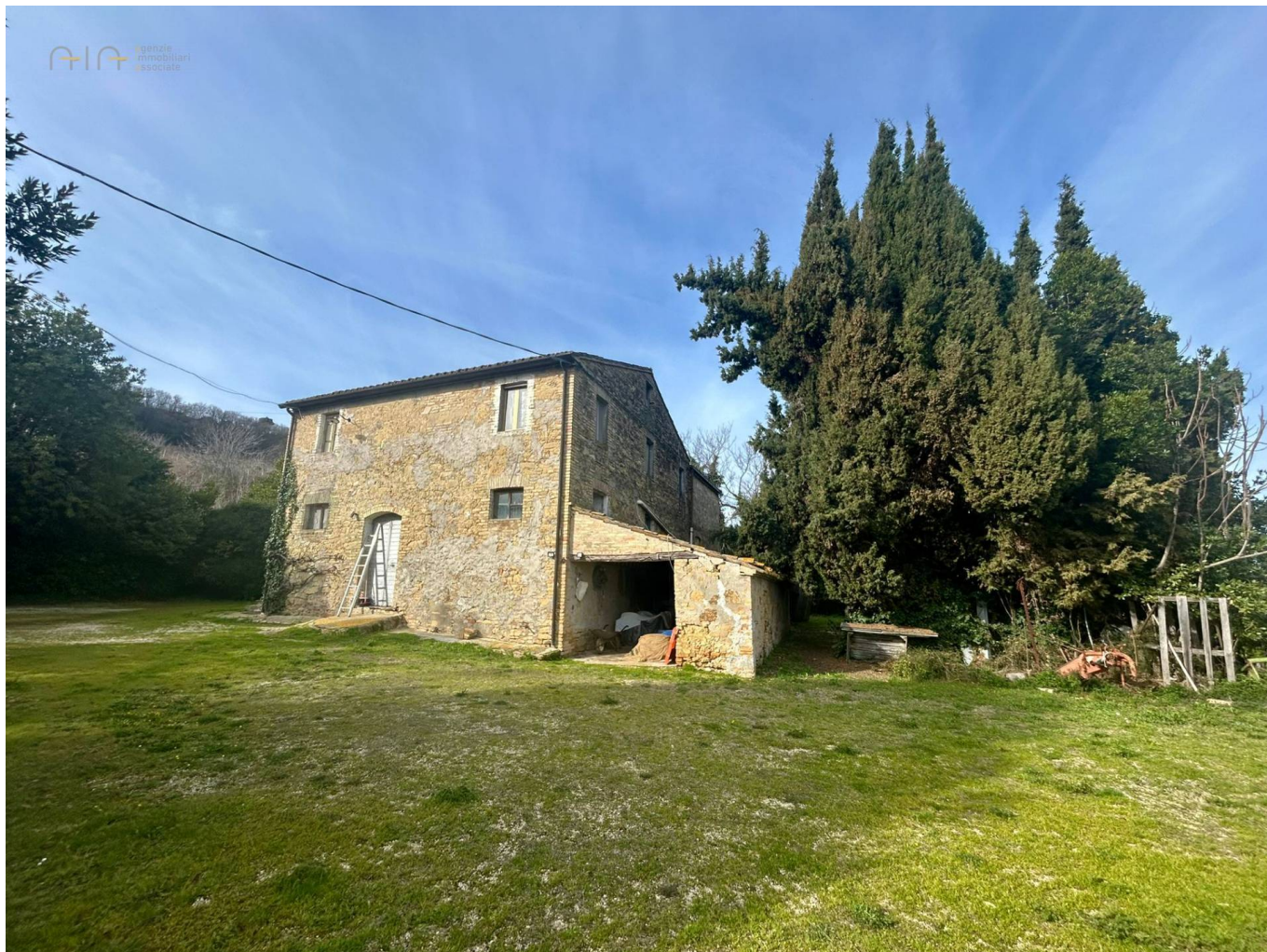
Podere San Biagio

330 mq | Bagni: 1 | Camere: 5 | Locali: 10