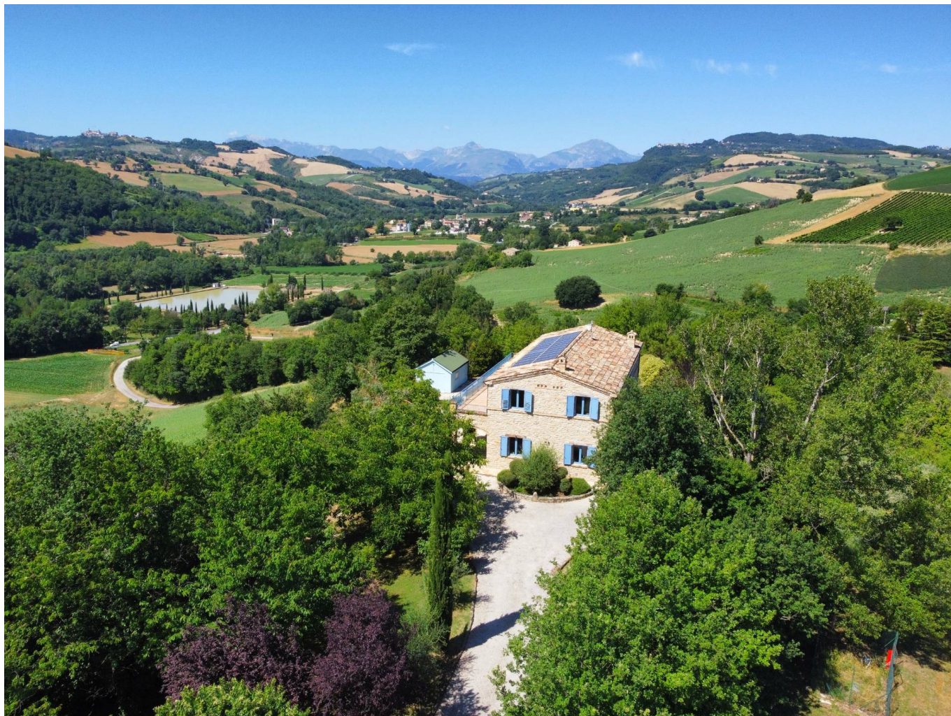
Casale delle Rose - VENDUTO

300 mq | Bagni: 4 | Camere: 3 | Locali: 6