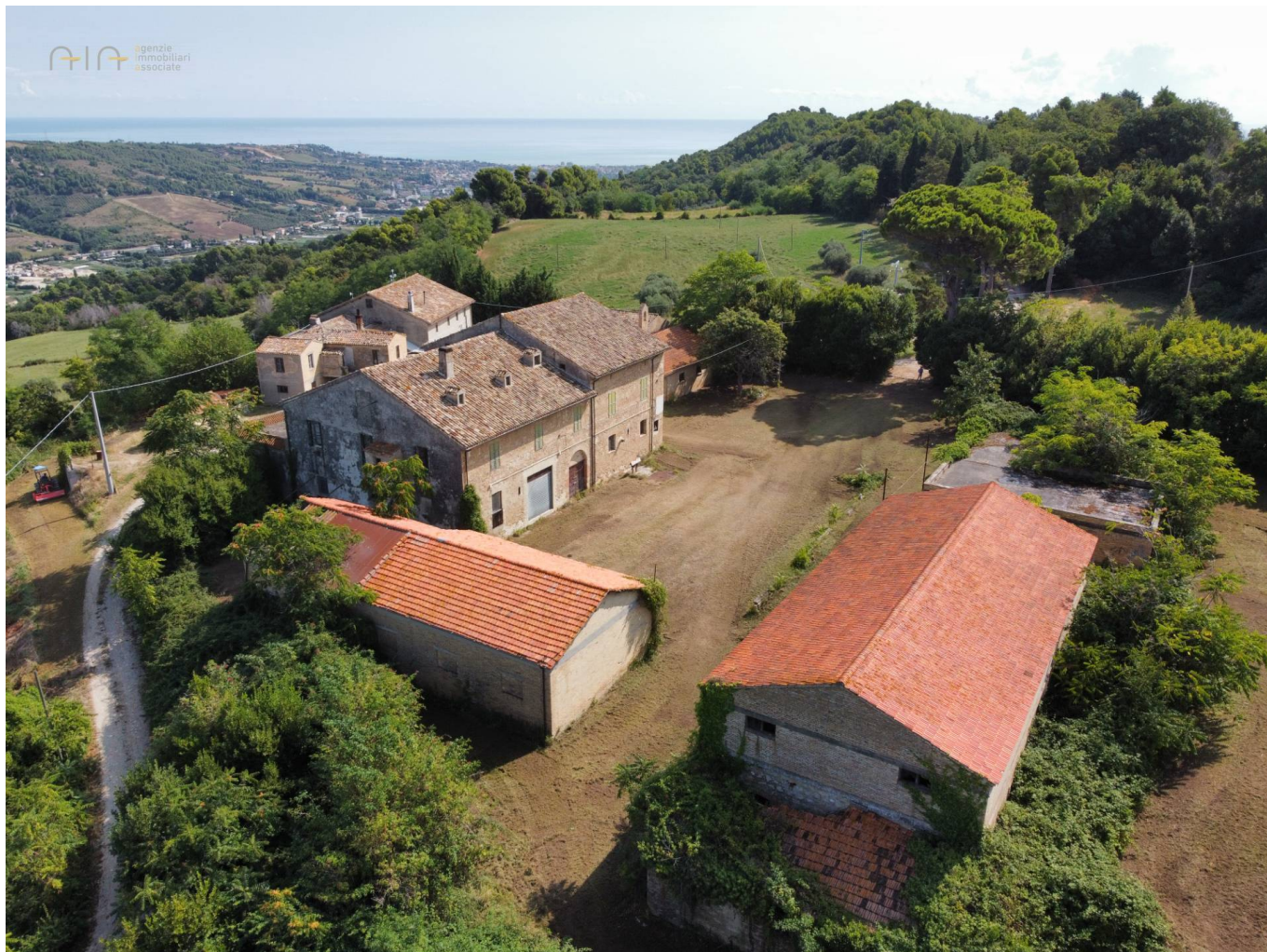
Borgo della Contessa

2.805 mq | Bagni: 3 | Camere: 6 | Locali: 12